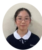
4 年生 Fさん

車でのお迎えの時は、絵本を読んだり、お家の人と話をしたりしているよ！お父さんがお休みの日は迎えにきてくれて嬉しいな。