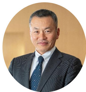
1995 年より本校で奉職 2024 年度より学校長に就任

私は 2019 年度より教頭、副校長を経て、今年度より校長に就任いたしました。昨年度まで約 30 年にわたり理科の授業を担当していたので、卒業生の皆さんにとっては「理科の先生」といった方がわかりやすいかもしれませんね。「理科の先生が校長先生になった！」ということで、びっくりした人も多いのではないのでしょうか。