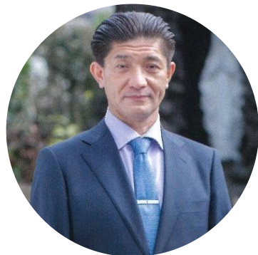
本校卒業生・在校生保護者 学校医

学園は今年で開校 95 周年を迎えました。これは建学の精神である「信じ、希望し、愛深く」のもと、多くの方々に支えられ、地域に親しまれて来たからこそ実現できたことと感謝しております。